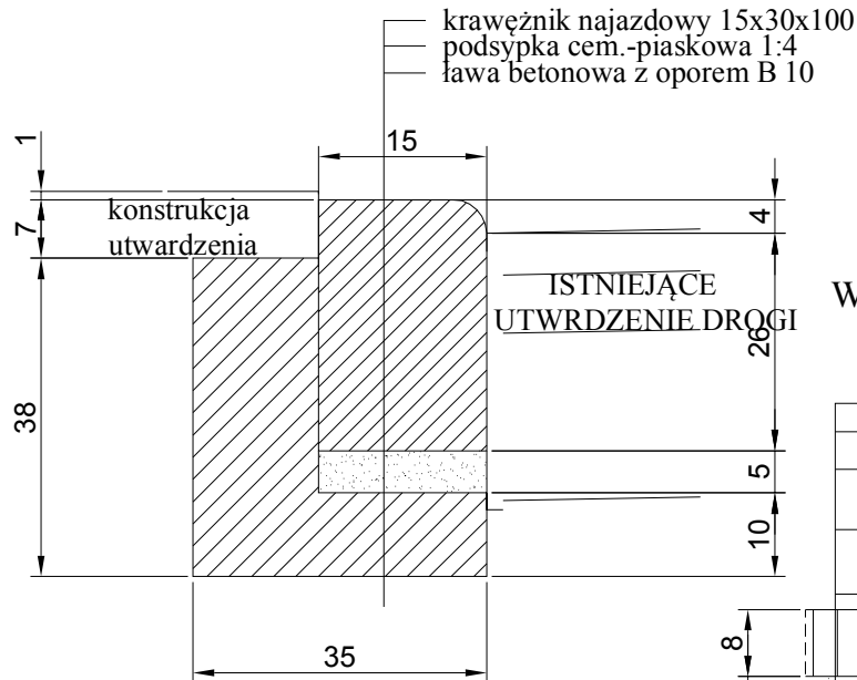
Warstwy konstrukcyjne utwardzenia skala 1:10